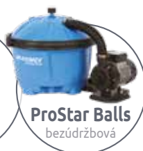
ProStar Balls bezúdržbová